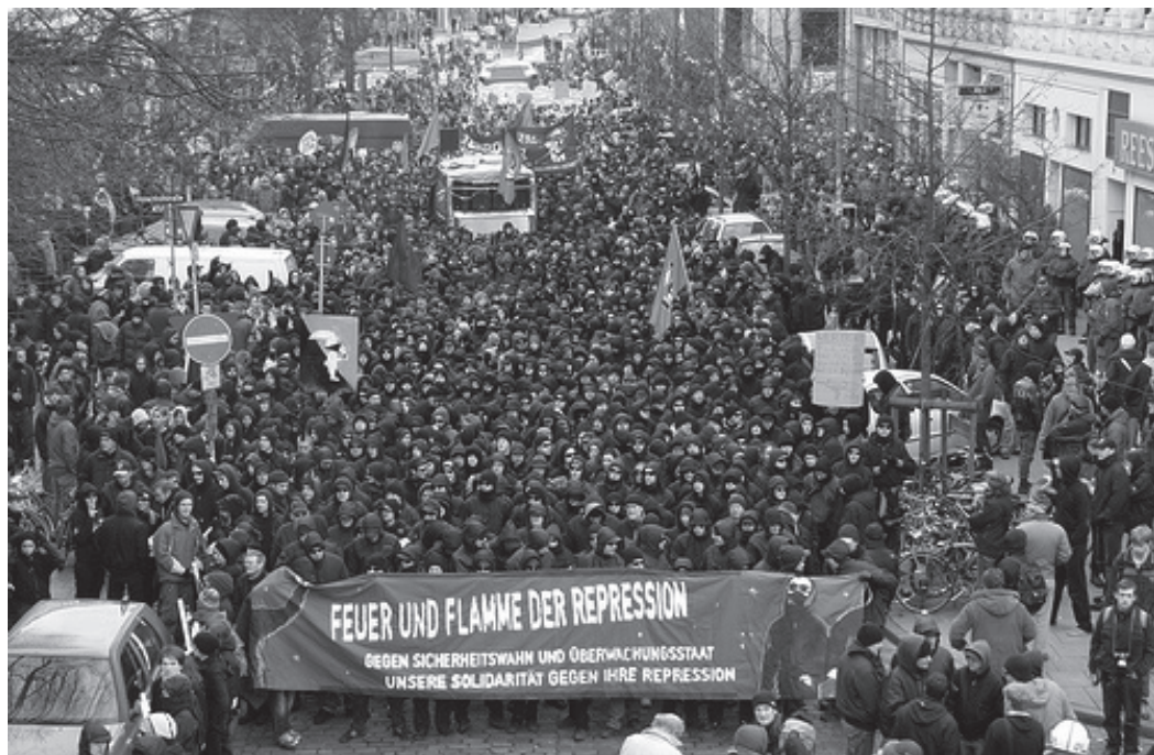
4000 demonstrieren am 15. Dezember in Hamburg gegen Repression, soziale Kontrolle und den Überwachungsstaat.

Eigentumsvorbehalt: „Die Broschüre ist solange Eigentum des Absenders, bis sie dem/der Gefangenen persönlich ausgehändigt worden ist. „Zur-Habe-Nahme“ ist keine persönliche Aushändigung im Sinne des Vorbehalts. Wird die Broschüre dem/der Gefangenen nicht ausgehändigt, ist sie dem Absender/der Absenderin mit dem Grund der Nichtaushändigung zurückzusenden.“